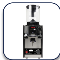
Coffema Slingshot S75/S68 volumendosierende Mühle