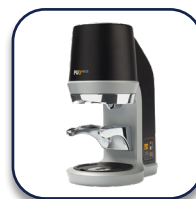
Coffema Tamper Puqpress Präzisionstamper