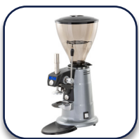
Coffema CXDT Direktmahlmühle